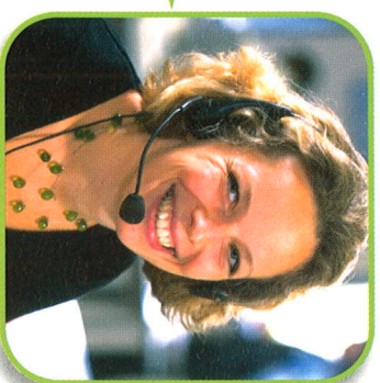
votre contact Télé assistance

Selon votre situation, votre interlocuteur constate votre besoin d'assistance en dialoguant avec vous et organise les interventions appropriées (urgences, médecin traitant ou proches). Il restera en contact avec vous jusqu'à l'arrivée des intervenants.